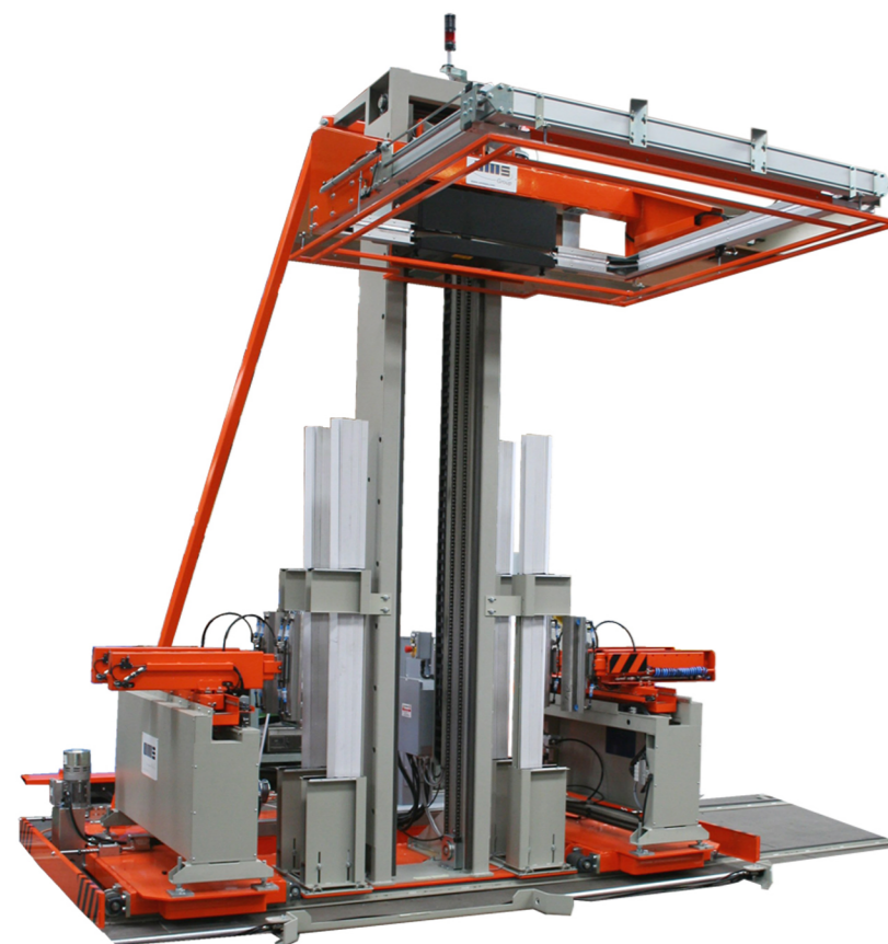
con traslazione with translation device