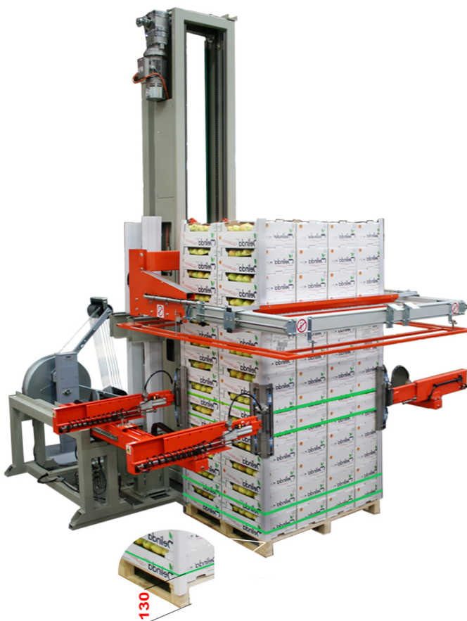
con mettiangolari with corners application device