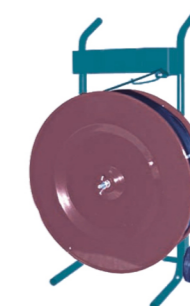
PORTABOBINA coil holder

Portabobina versione a carrello Carriage type coil holder