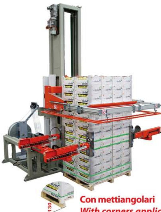
Con mettiangolari With corners application device