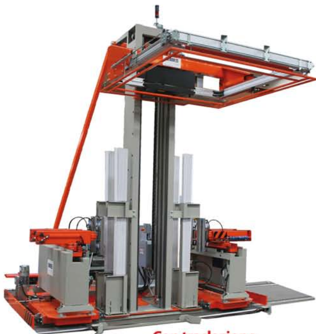
Con traslazione With translation device

It can be equipped with a device (optional) to apply protective corners to the four sides of the pack and translation the entire machine (optional).