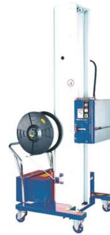
SM202 MHB Con batteria ricaricabile With rechargeable batteries

Horizontal semiautomatic strapping machines for pallets.