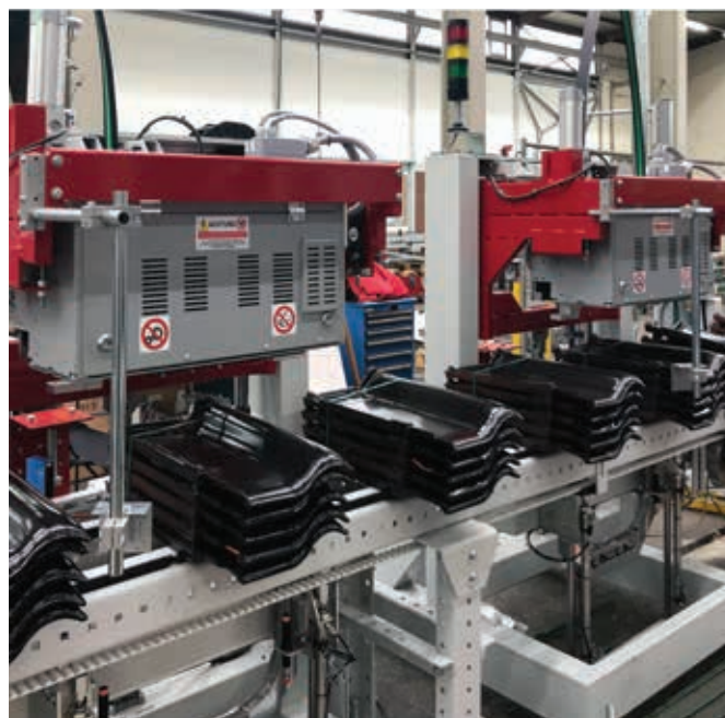
Dettaglio regolatore manuale della tensione.